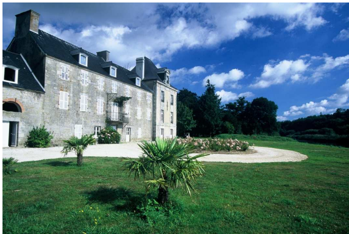
Le manoir de Saint-Urchaut

C'est aussi l'occasion de découvrir la ville de Pont-Scorff et le Bas-Pont-Scorff au riche passé historique : Maison et place des Princes, pont Saint-Jean, chapelle Notre-Dame de Bonne Nouvelle... Laissez-vous tenter par son patrimoine culturel : la Cour des Métiers d'Art et les artisans d'art, l'Espace Pierre de Grauw, l'Atelier d'Estienne et les expositions d'art contemporain (notamment « L'Art Chemin Faisant » parcours d'art en été), l'Odysseum (espace de découverte du Saumon Sauvage), la Maison du Scorff.