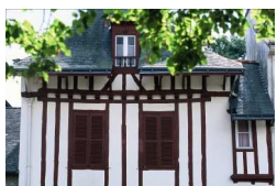
Maison à pan de bois Place de la Maison des Princes